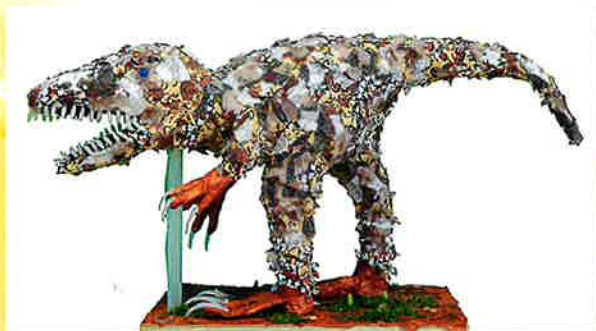
きょうりゅう、おおきいな 杉原 和成(福井県)