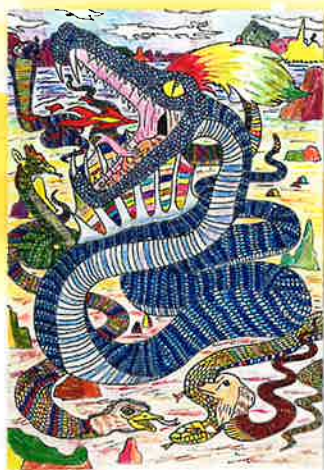
あれ?みんなへびに なっちゃった! 斉藤 諒(山形県)